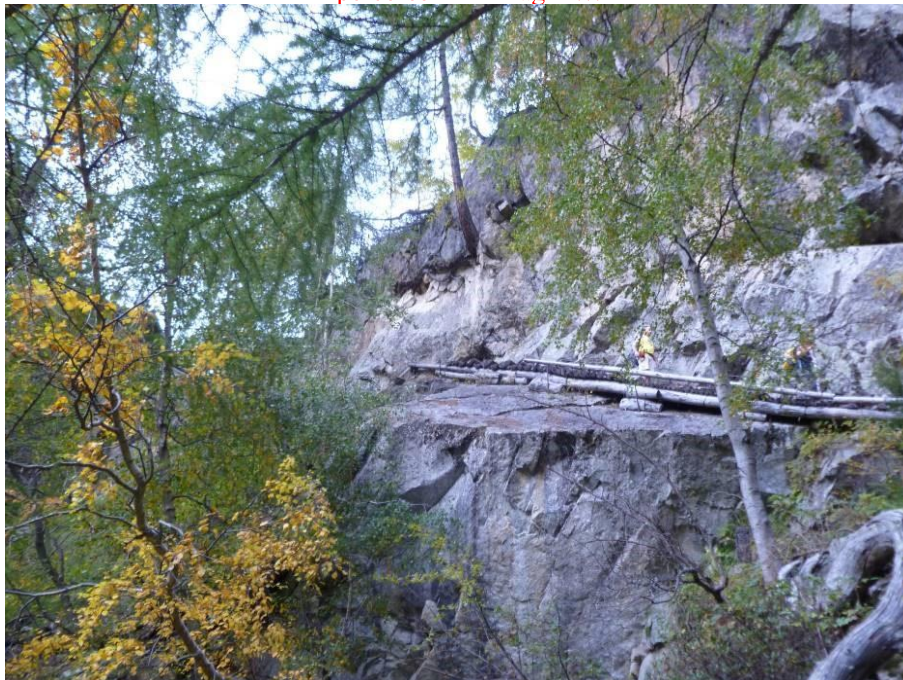
La cengia rocciosa su cui si sviluppa la Scalaza lungo il sentiero 206