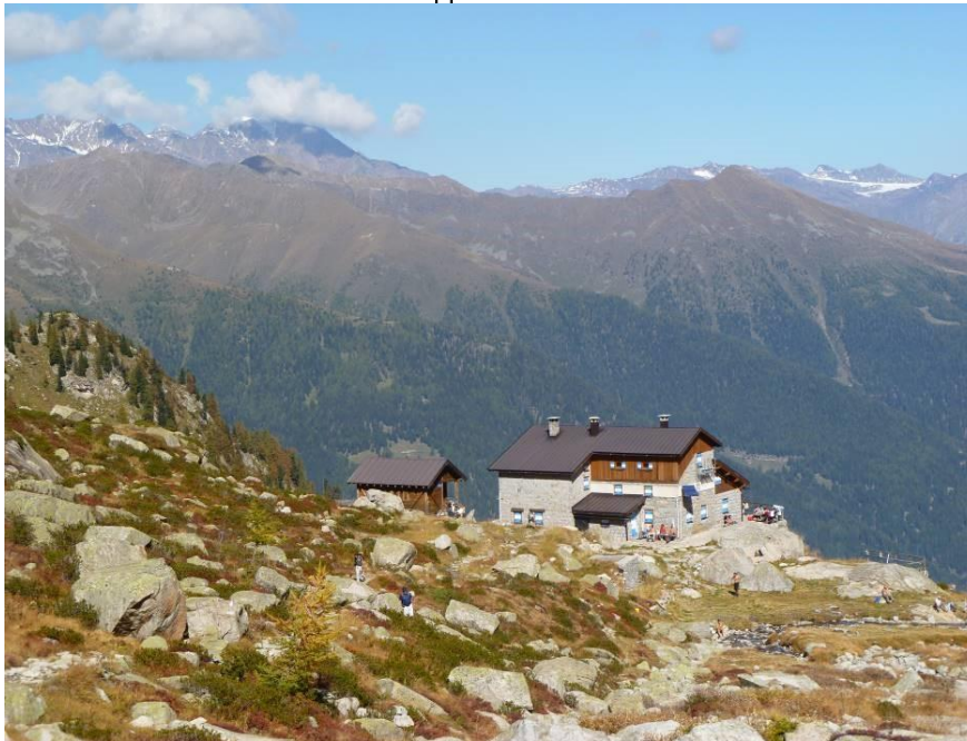
Il Rifugio Stavel "Francesco Denza" – quota 2.298 m s.l.m.

Prossime Escursioni: Domenica 17/09 - Compleanno al Rifugio Telegrafo e festa della Sezione di Verona - E Domenica 24/09 - Sui sentieri della grande guerra e il bramito del cervo – E Domenica 1/10 – Monte Biaena (Prealpi Trentine) – E