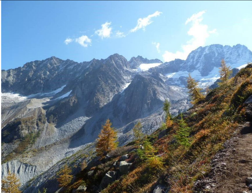
Il versante Nord del Gruppo della Presanella dal sentiero 206