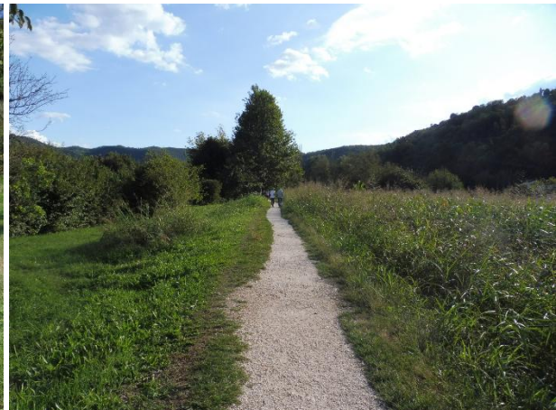
Tratti su stradine sterrate verso il Lago di Fimon