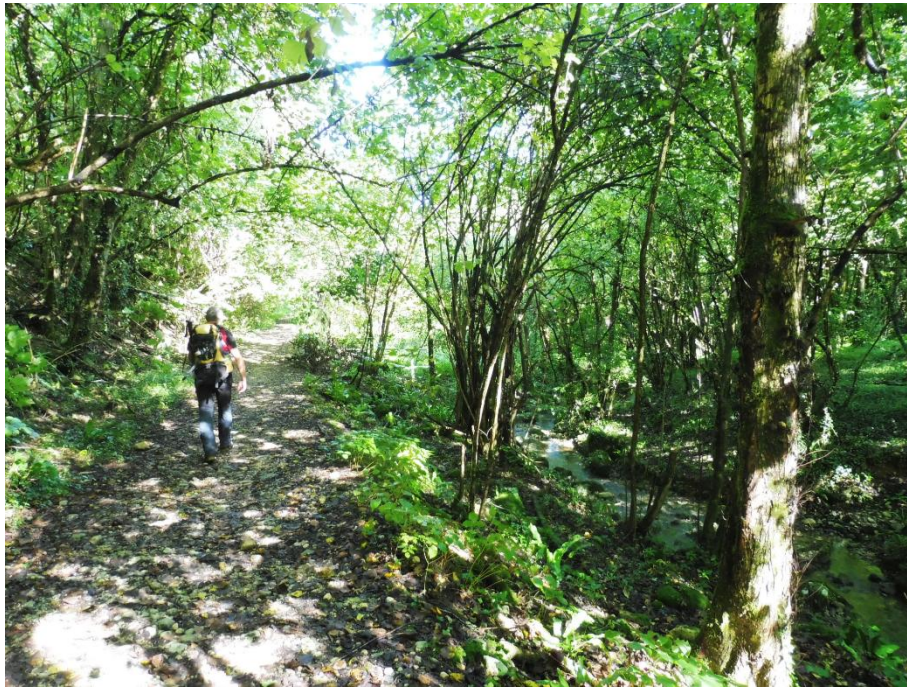
Tratto di percorso nella Valle dei Mulini con il corso d'acqua sulla destra