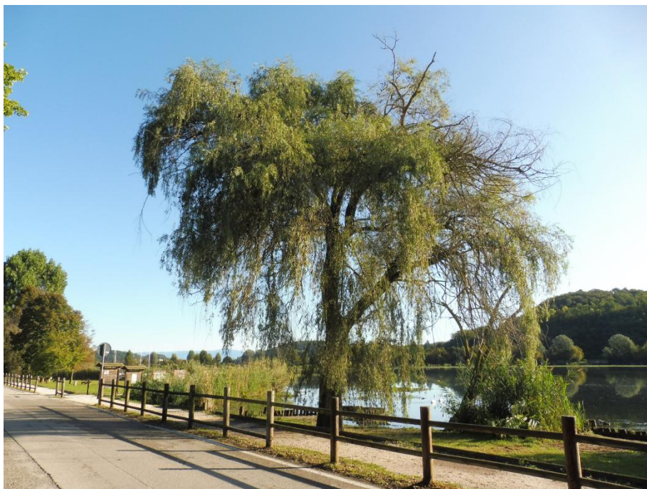
Il lago di Fimon alla partenza dell'escursione