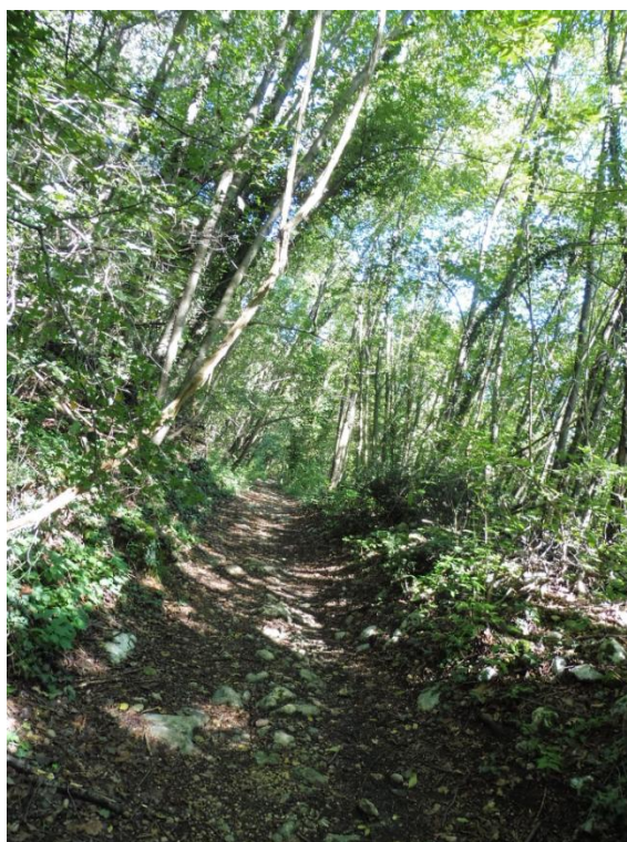
Tratto di percorso nel bosco che ad ottobre avrà i primi colori d'autunno