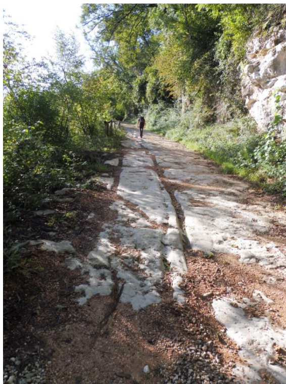
Tratto del percorso su fondo roccioso con i solchi delle ruote dei carri che nel tempo hanno percorso questo antico sentiero a mezza costa