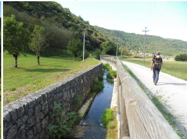
Tratti su stradina asfaltata verso il Lago di Fimon