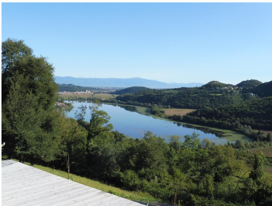
Il lago di Fimon dal sentiero del Percorso Verde verso la Valle di Mulini